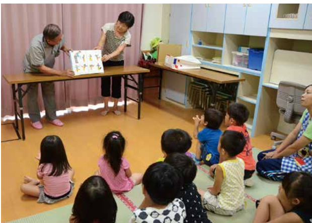
子どもたちへの読み聞かせの様子