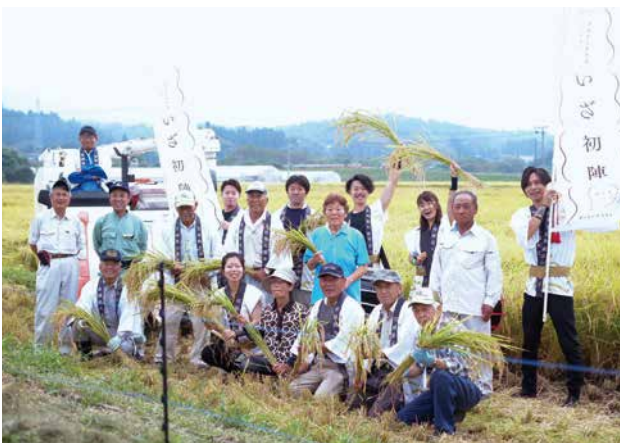
ブランド米「いざ初陣」の収穫