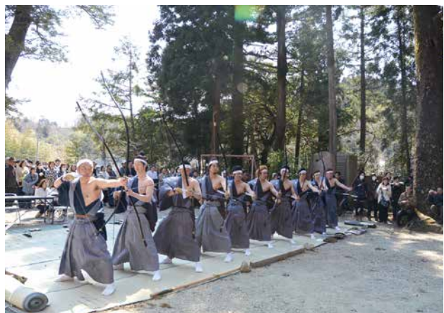
やぶさめ 奉射祭（小斎地区）