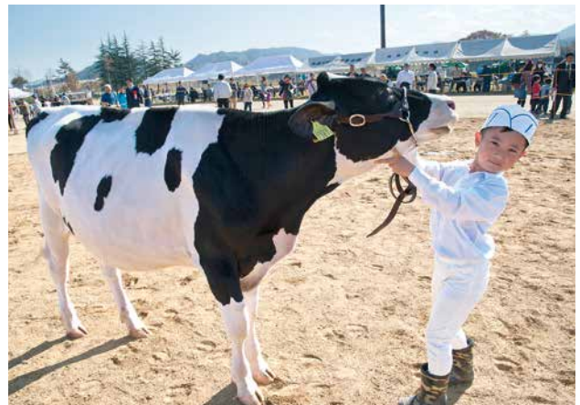
「モーモーまつり」の様子