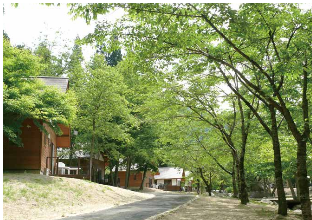
不動尊公園キャンプ場