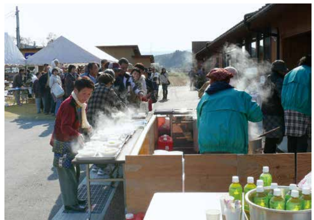
自然薯じゅうねん収穫祭 (大内地区)