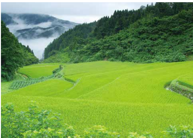
沢尻棚田（大張地区）