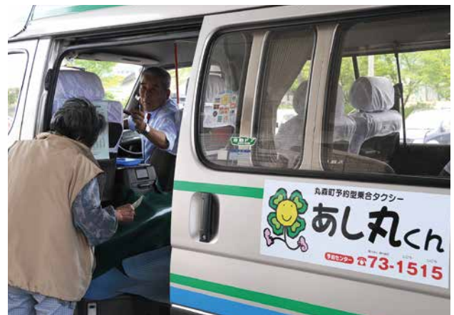
デマンドタクシー（あし丸くん）