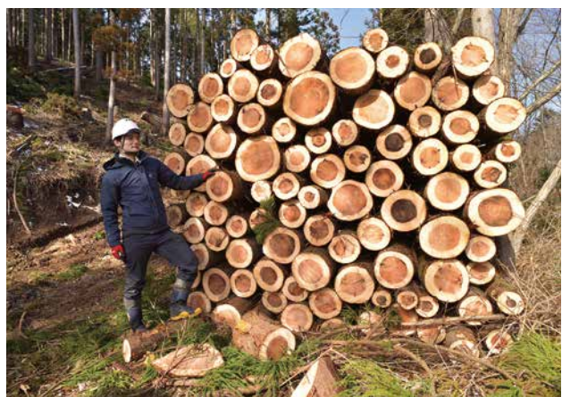
切り出された町産材