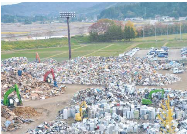
令和元年11月7日時点