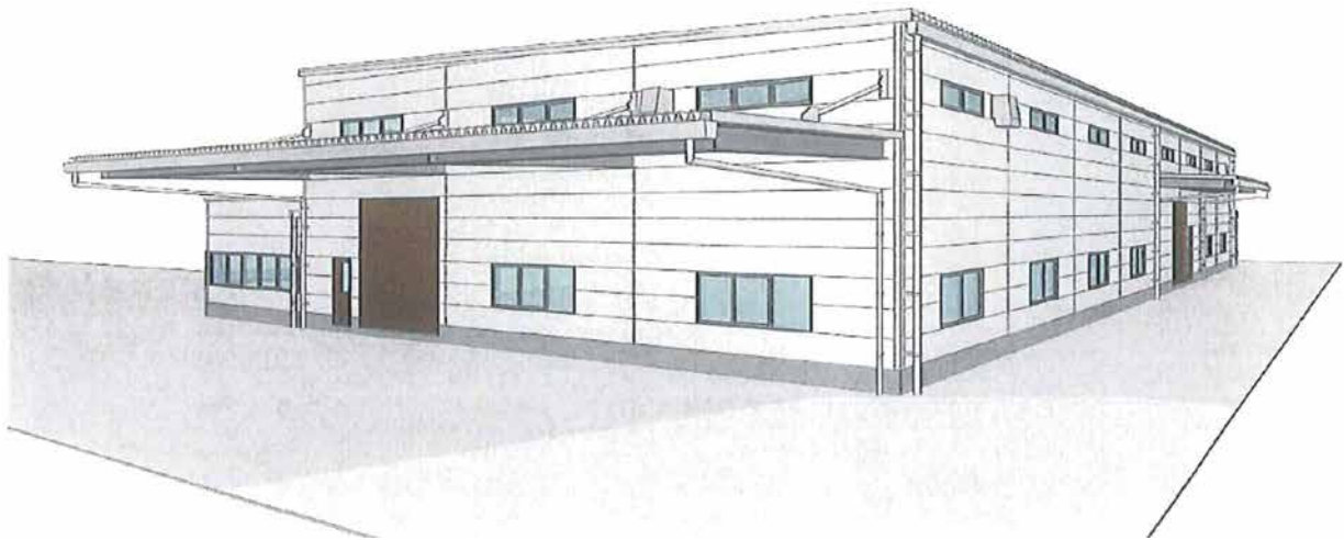
（仮称）金山工場団地に立地する企業のイメージ