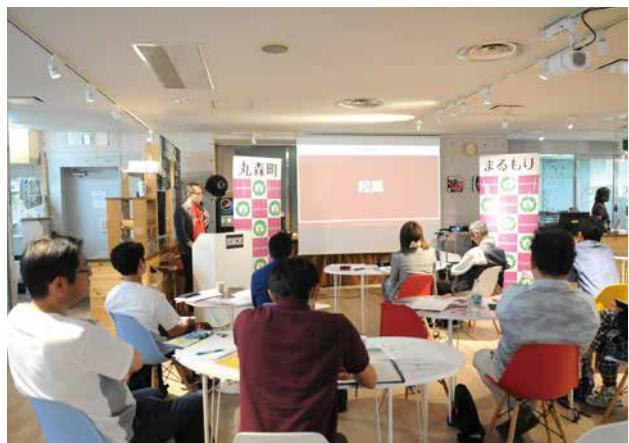
起業に関するセミナーの様子