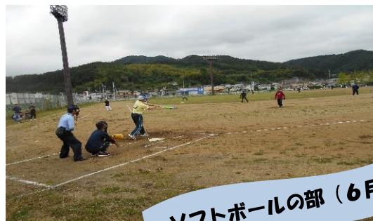
ソフトボールの部(6月)