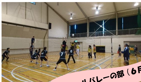
ビニールバレーの部(6月)