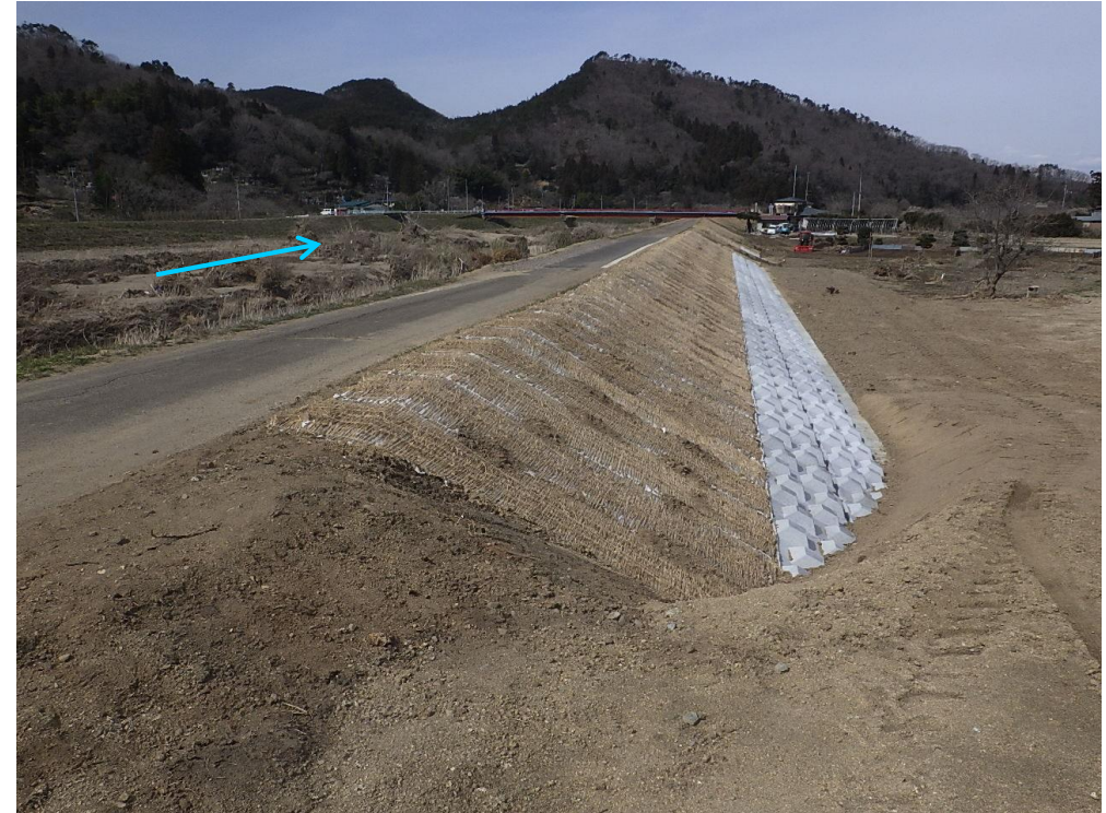
右岸堤復旧状況 (完了)