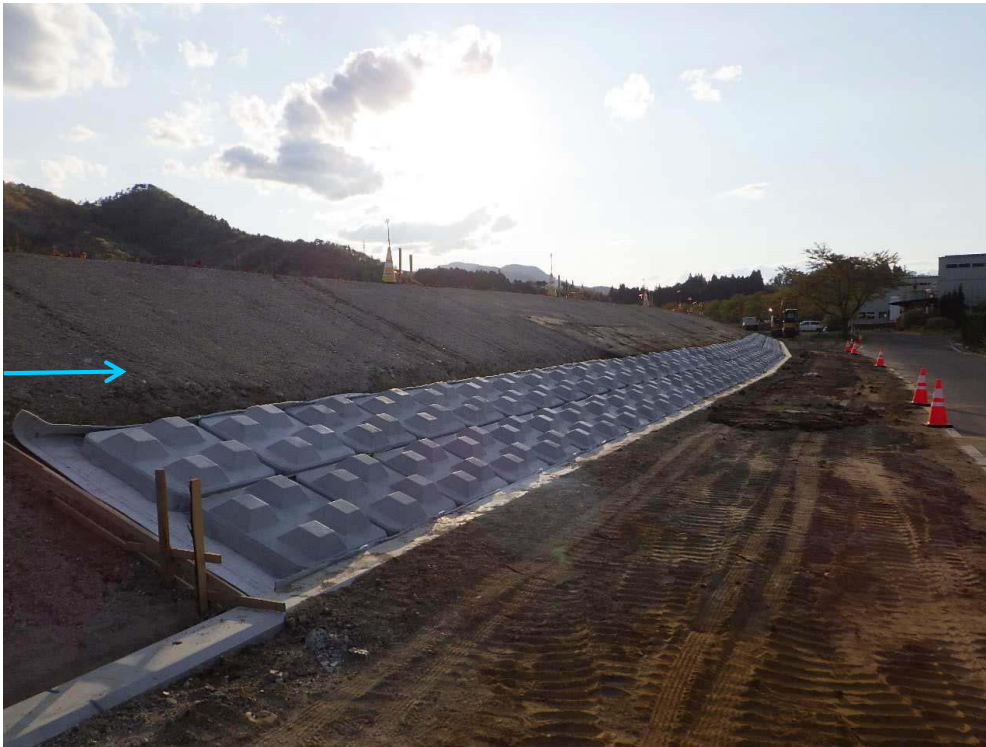
右岸堤復旧状況 (施工中)