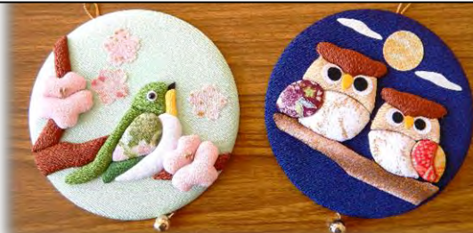
今回「ふくろう」を作り「メジロ」はプレゼントとしてお渡ししました。