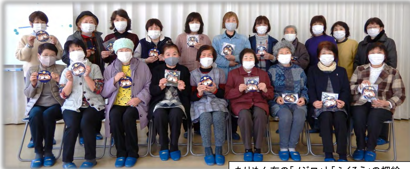
ちりめん布の「メジロ」と「ふくろう」の押絵。

3月8日(月)に第2回・かねやま結び塾を開催しました。20名の方々にご参加いただき、今回は「かんたん押絵」を作りました。パーツをちりめん布で包み、飾り付けていく作業は手と頭の良い運動になりました。皆さんそれぞれ個性的な作品が出来たようです。令和2年度の「かねやま結び塾」は今回で終了です。来年度もまた多くの方々のご参加をお願いいたします。