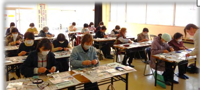
小さいパーツも多く、なかなか細かい作業です。