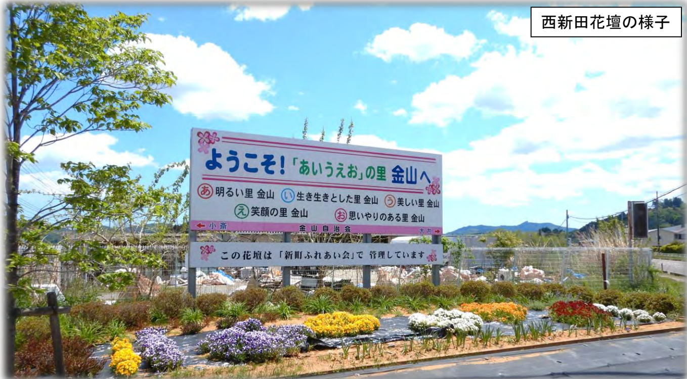
西新田花壇の様子

今年も、地区別計画事業「花木による環境美化活動」の一環として、道端花壇用の花苗の配付を行います。運営委員さんを通じて希望がありました地区に、 花苗を6月18日(金)に配付 いたします。地区の花壇やプランターにご利用ください。