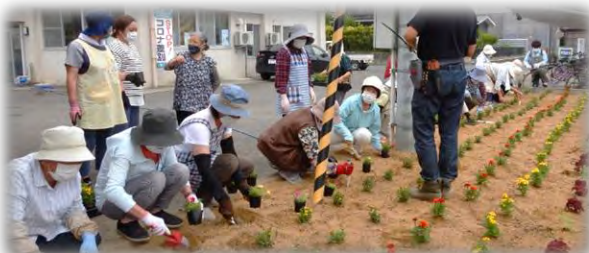
マスクでの作業、お疲れ様でした。