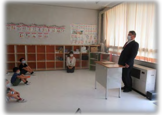
第2学期始業式 めあてを持って(換気をし、距離をとりながら)