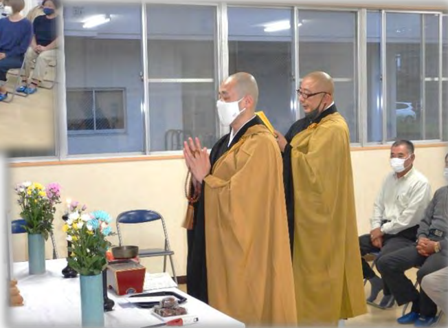
読経する瑞雲寺・溪水寺の副住職