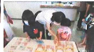
「子どもマルシェ」どれにしようかな？