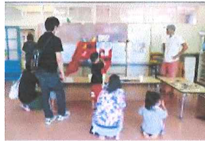
みんなで竹太鼓をしたよ。

新型コロナウイルス感染症感染対策のため、参加者の人数制限や時間短縮で行いましたが、大人も子どもも楽しいひとときを過ごすことができました。数々のご協力ありがとうございました。