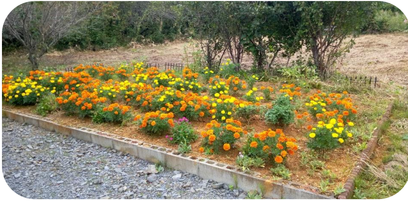
▲ マリーゴールドが満開！（10月撮影）

清水上F・F会のみなさんは、清水上集会所前の花壇と、そこから東にある農免道路沿いの花壇において、花のある地域づくりに取り組まれています。