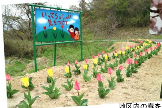
チューリップロード