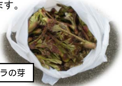
被害品のタラの芽

現時点ではタラの芽が主な被害品になっていますが、これから、わらび、筍と続きますので、規制表示などのご協力お願い致します。