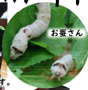
さすが大張っ子!慣れた手付きです。