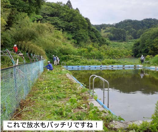
これで放水もバッチリですね！