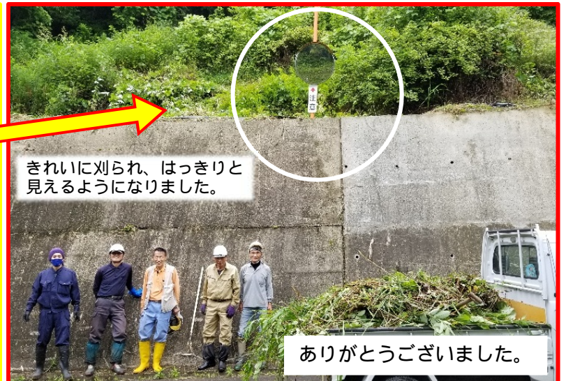
きれいに刈られ、はっきりと見えるようになりました。