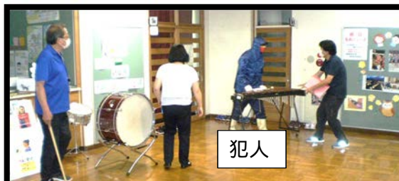
訓練の様子（教職員が犯人を追い込む状況）

全体的に良く出来ていましたが、教職員から「たぶん私は刺されていた」と感想があり、知識と訓練の大切さを実感して頂けました。皆様、大変お疲れ様でした。