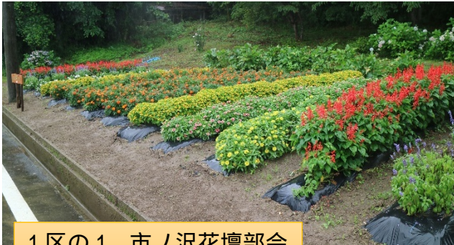
1区の1 市ノ沢花壇部会