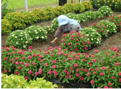
1区の2 松ノ塚仲よし会