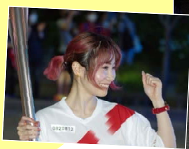
皆さん貴重なトーチを目に焼き付けていました！

トーチは長さ71cm、重さ1.2キロ。アルミ製で日本人に最もなじみの深い桜をモチーフとしているそうです。