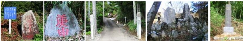
道しるべ 庚申塚 虚空蔵山入口 百庚申塚 柳剛流

まちづくりセンター発 松の口『道しるべ・庚申塚』 台『1区の1集会所休憩』 市ノ沢『虚空蔵山入口』 『大蔵寺休憩』 寺前『百庚申塚』 美録『枯露里さん』 硯石 柳剛流 『銭洗い井戸』 松の口 まちセン着