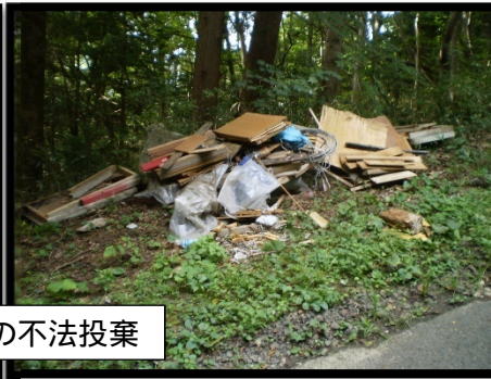
石田地内の不法投棄

角田警察署交通事故係の担当者から最近の事故特徴を聞いたところ「交差点などで停車するまでは良いけど、止まったことに満足して、左右の安全確認をしないで事故を起こす方が多いです」と言っていました。