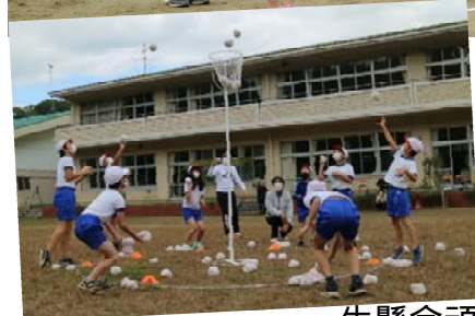
一生懸命頑張りました！