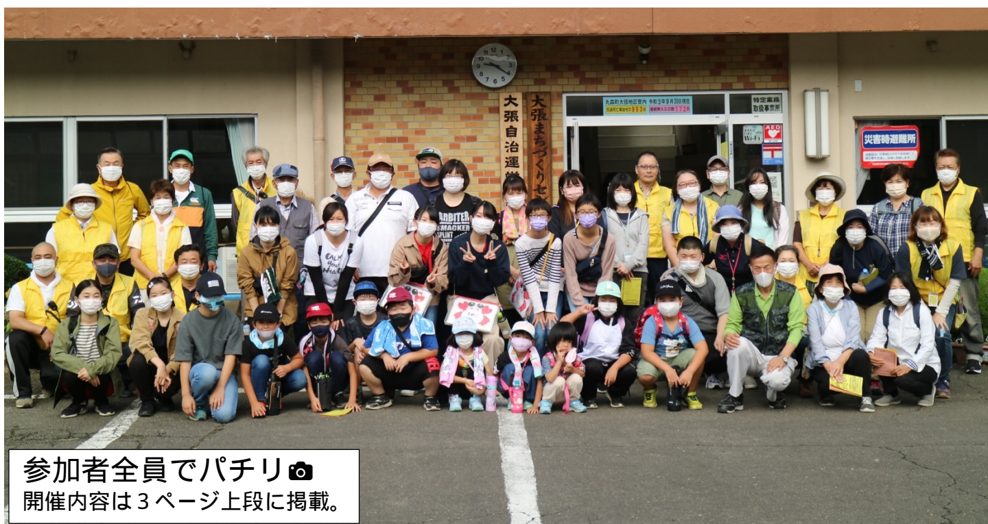
参加者全員でパチリ📷 開催内容は3ページ上段に掲載。

10月10日(日)最高の秋晴れの中開催された『歩こう歩こうみんなて歩こう』51名の方に参加頂き、大張の自然を満喫しながら総距離4.8kmを歩きました。