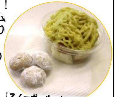
「スノーボール」と「さつま芋モンブラン」

「さつま芋モンブラン」はクリームたっぷり食べ応え十分。やっぱり手作りが一番！お菓子作り教室は計3回です。次回11月9日(火)『バイクドチーズ』『レアチーズ』2種類のケーキに挑戦。3回目は『パウンドケーキ』を作ります。楽しみですね。