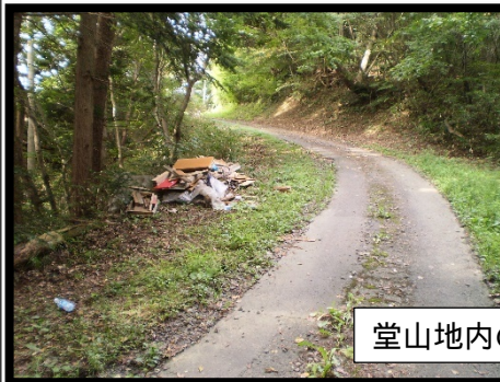
堂山地内の不法投棄