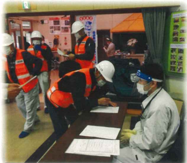
区長さんから被害状況が報告されました。