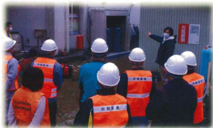
役場総務課の担当者から、災害時に停電が発生した際、LPガスを燃料に発電するという説明がありました。実際、運転を行い館内の非常用電源が使える事を確認しました。

3月14日(日) 耕野地区防災訓練を開催しました。 今回はコロナ感染症対策の関係で参加人数を縮小(区長12名、役員4名、消防団員4名、大張駐在所長、役場7名、職員5名)とし、台風による大雨のため、警戒レベル3が発令され、高齢者などに避難指示が出されたことを想定としました。