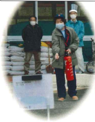
水消火器による初期消火訓練

地区担当役場職員から区長さんへの「通報訓練」と、区長さんからの「被害報告」コロナ対策をおこなった避難所開設として「テントの設営」非常用電源の確保、消火訓練など行いました。