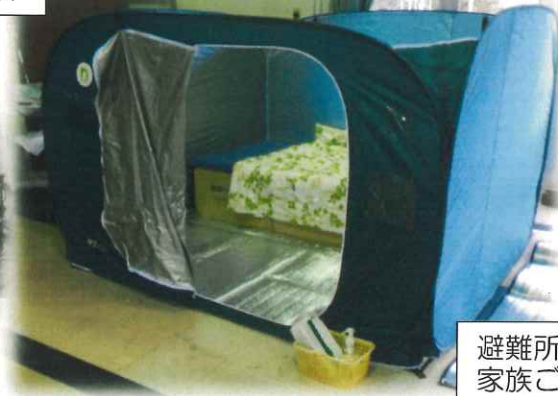
避難所開設：コロナ対策でテントを組立。家族ごと利用でき、ダンボールベットも設置。入り口には、消毒液とペーパータオルを置きました。