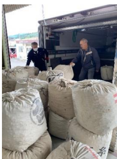
今年最後、晩晩秋蚕の出荷

養蚕農家さんにお邪魔して取材をしました。初めて養蚕を見ました。初めて養蚕を見ました。お蚕さんのようにザンビアにもただ者ではない虫がいるかもしれない目を光らせたいと思います。