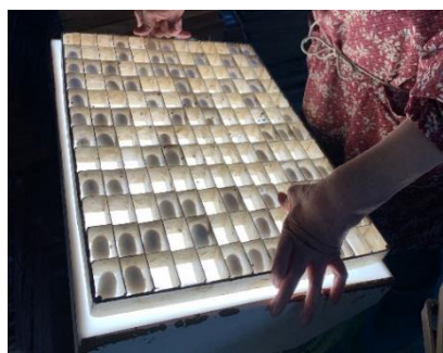
選繭作業：光を当てます