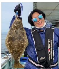
相馬沖でヒラメ釣り

人生初、地域おこし協力隊をきっかけに東北地方に降り立ちました。耕野に5月に引っ越して早半年。皆さんとても働き者で元気！本当に頭が下がります。ほとんど自給自足で体にいいものばかり。健康になれそうです。冬が長いせいか知恵のある保存食が多く、味付けが九州より塩気が効いてる気がします。すみません…方言が外国語のようでした。皆さん優しいので解説しながら会話してくれます。野生のカモシカ、キツネは耕野に来て初めて見ました。何もかも新鮮で驚きの連続です。