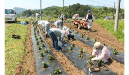
「大内西部地域資源保全会」 の花植え