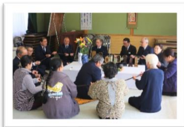
「下町契約会」念仏講