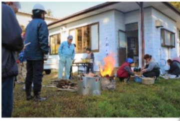
竹ノ内の防災訓練