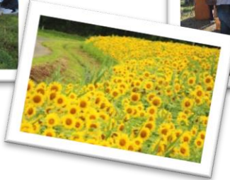
西向・松沢の ひまわり畑