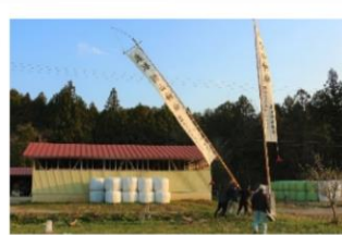
羽山神社 祭旗掲揚