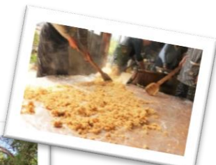
継承される共同味噌づくり