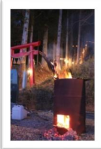
熊野神社 どんと祭