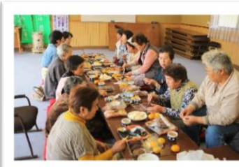
横手「うぐいすの会」