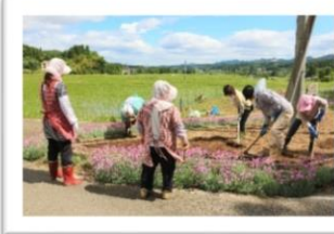
南平の花植え作業