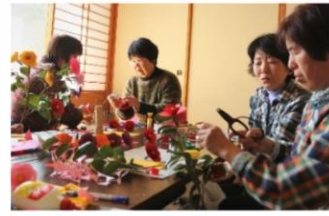
「横手レディースで彼岸花づくり」