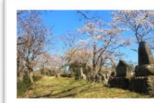
徳寿坊公園 春桜／紅葉