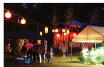
かせどり 中平の盆踊り