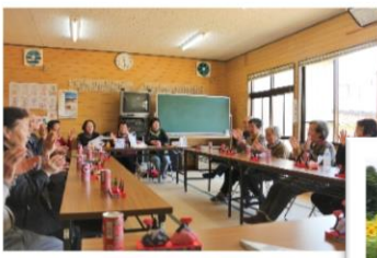
山屋敷「やまぶき会」