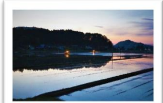
夕暮れの田植え風景