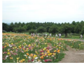
生きがいづくり大内 移動研修(7/17)