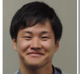
大内地区 地域おこし協力隊