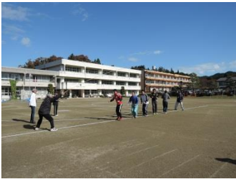
ふるさと大内健康まつり みんなでジャンプ(10/28)