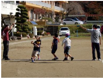
ふるさと大内健康まつり パン食い競走(10/28)