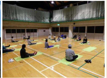
第1回健康運動教室 (10/31)