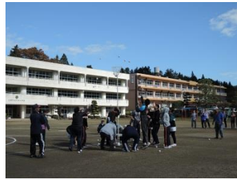
ふるさと大内健康まつり 紅白玉入れ競争(10/28)