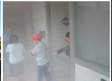
小学校合同防災訓練 (11/5)

感想・目標 10月は「運動・健康の秋」イベントが盛り沢山でした。普段車での移動しかしていないため、年配者に比べて体力が落ちていると感じました。普段から散歩をしている方が元気であり、長生きをする秘訣だと思いました。健康の秘訣を外に発信するだけではなく自分自身が実践をしていきます。 昨年の11月に丸森町に来て早1年が経過をしました。大内弁は分からないことが多く、話についていくのが精いっぱいでしたが、今ではその人に合わせたしゃべりが出来るようになった気がします。まだ地域の名所や歴史についてはまだ知らないことも多いため、もっと大内の事を知っていけるように努力をします。