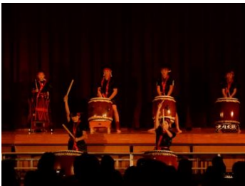
大内小学校学習発表会 6年生太鼓(10/20)