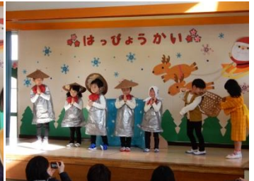
大内保育所 クリスマス発表会(12/1)