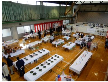
ふるさと大内文化祭 (11/10.11)