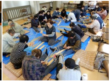
生きがいづくり大内 (11/20)