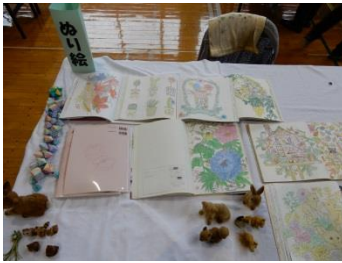
ふるさと大内文化祭 (11/10.11)