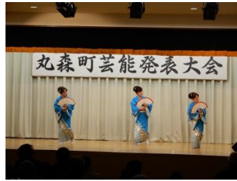
丸森町芸能発表大会 (11/18)