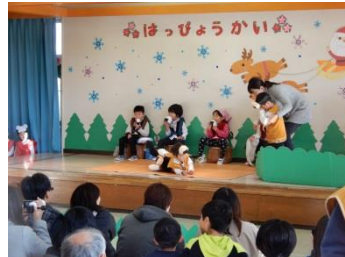
大内保育所 クリスマス発表会(12/1)