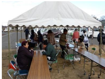
おしるこの振る舞い

らず色々な所からお 客さんが来ていたため、 楽しみにしている人が 居るんだと思いました。