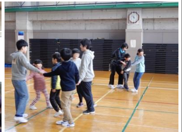
子ども会育成会・ クリスマス会(12/23)