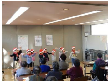
生きがいづくり大内 (12/18)