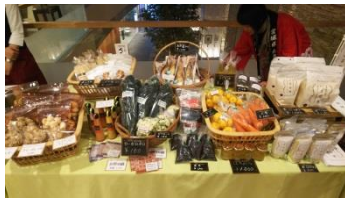
仙台で丸森マルシェ (12/8)