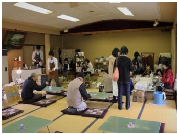
青葉温泉カフェ・春 (4/21)