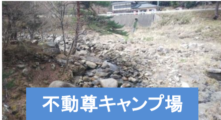
不動尊キャンプ場

前職の同期が来ました 4月5日～7日、埼玉から車で前職の同期が遊びに来てくれました。事前の連絡もなくサプライズで来てくれたので驚きでしたが、初めて友達が出来たのでうれしかったです。丸森、白石、仙台、松島、気仙沼大橋、陸前高田など色々な場所を見て周り、丸森では不動尊キャンプ場やいきいき交流センター大内の見学、農村レストラン味の里で昼食をとって過ごしました。晴れていたため夜の星を見せたら「すごい綺麗」と喜んでいました。業務での案内だけでなく、友達に観光として来てもらいたい案内をするのも良いことだと思いました。