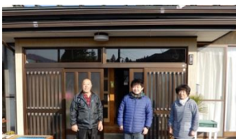
ホームステイ風景