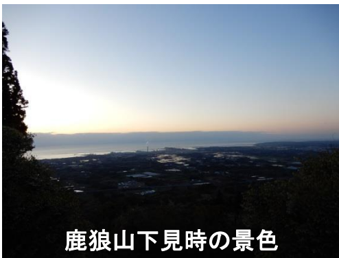
鹿狼山下見時の景色