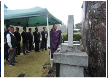
第8回新相馬節全国大会 成功祈願祭(5/1)