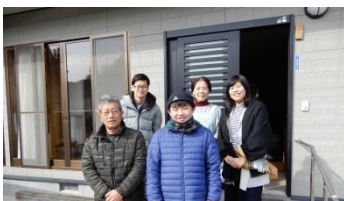
ホームステイ風景