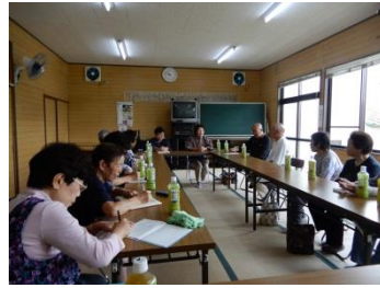
山屋敷お茶のみ会 (6/19)