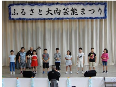
小学3年生新相馬節