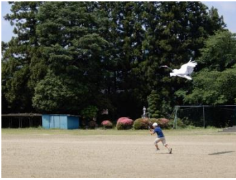
つる風を飛ばす会 (6/14)