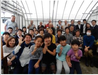
ヒュッテ・モモ1周年 (7/14)