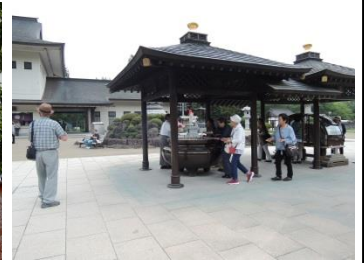
生きがいづくり(定義山) (7/26)