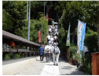
長寿会歩け歩け(山寺) (7/24)