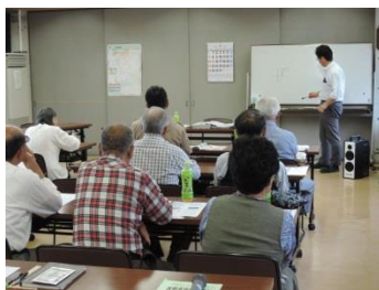
秋野菜栽培講習会 (7/22)