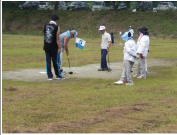
ふるさと大内球技大会 グラウンドゴルフ(9/1)