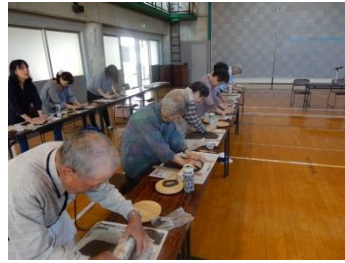
生きがいづくり大内 (9/27)