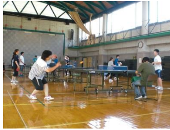
ふるさと大内球技大会 卓球(9/1)