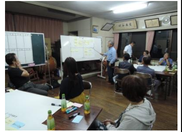
青葉ワークショップ (10/3)