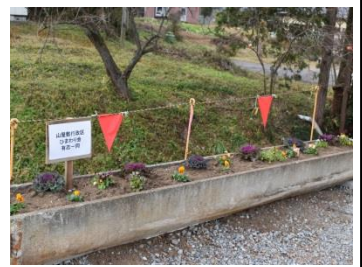
山屋敷行政区の花壇 (12/11)