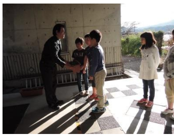
大内小学校プランター (11/5)