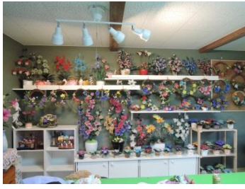
七夕行政区のアトリエ (10/24)