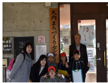
大内小学校町探検 (11/26)