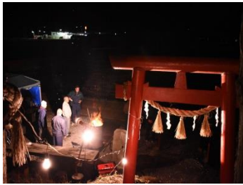
山屋敷・中平地区 熊野神社どんと祭(1/14)