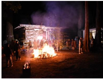
青葉地区 熊野神社どんと祭(1/14)