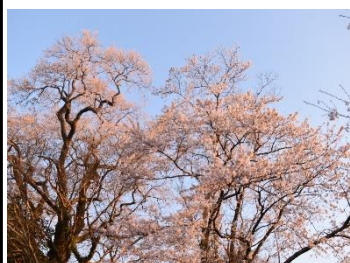
大内まちづくりセンター