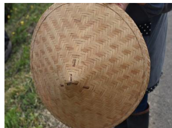
田植えで使った笠(5/4)