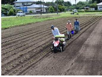
色麻町えごま視察(7/3)