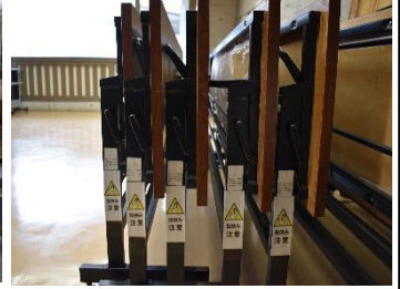
機の指挟みにご注意を