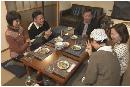
ヒュッテ・モモでの様子

分 NHK総合で 明日へつ なげよう ふるさとグング ン!』に、先日丸森町の地域 おこし協力隊等数名が取材 されたことが放送されます。 ぜひ見てください。