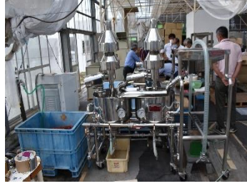
色麻町えごま視察(7/3)