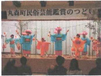
丸森町民俗芸能鑑賞