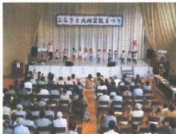
ふるさと大内芸能まつり