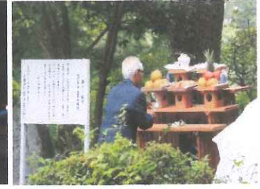
旗巻古戦場 百五十年祭