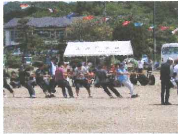
ふるさと大内大運動会