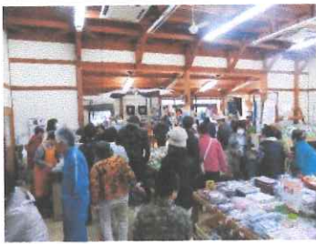
交流センター 周年祭