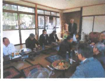
熊野神社春季例大祭