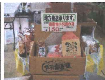
交流センター 新米まつり