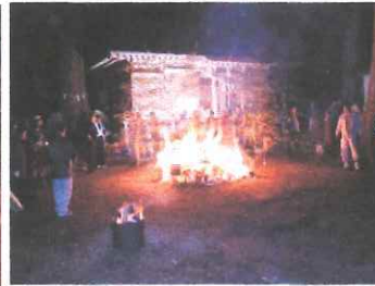
青葉熊野神社 どんと祭