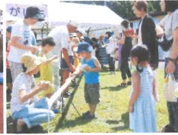
交流センター 夏まつり