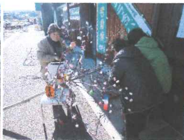
交流センター 団子差し