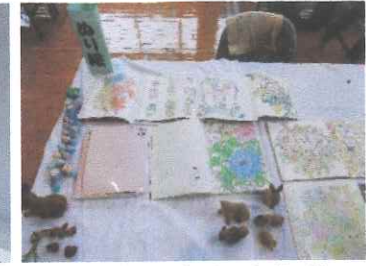
ふるさと大内文化祭