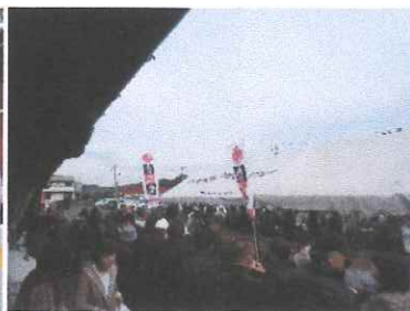
交流センター 自然薯まつり