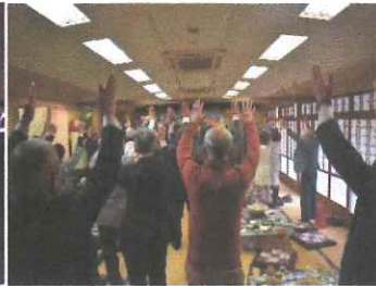
大内地区協議会 新年会