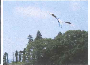
小学校 つる凧飛ばす会