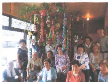
山屋敷 お茶のみ会