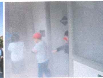
小学校と合同 防災訓練