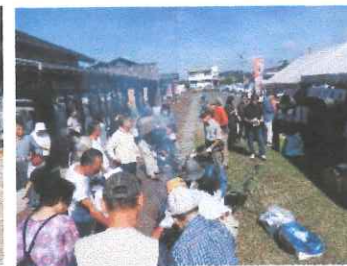
交流センター 秋の感謝祭