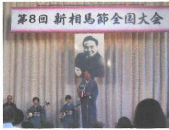
新相馬節全国大会