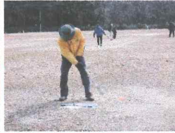
グラウンドゴルフ大会