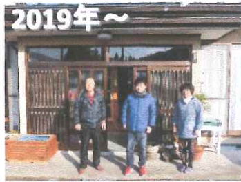
2019年～ 大学生受け入れ