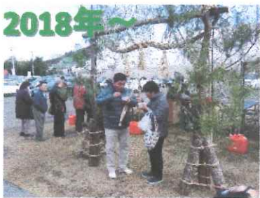
交流センター 初売り