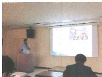
県の研修で事例発表