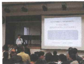
地域づくり取組報告会