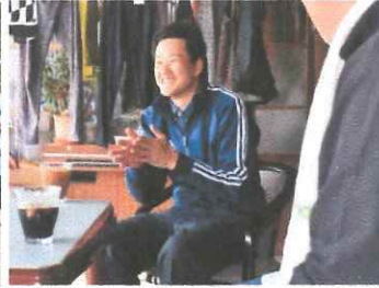
マイナビ農業取材