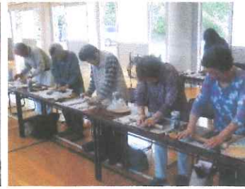
生きがいづくり大内