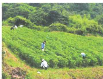
えごま援農ボランティア