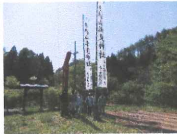
山津見神社旗揚げ