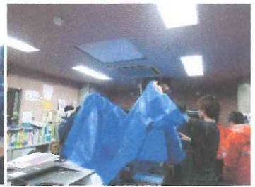
令和元年東日本台風