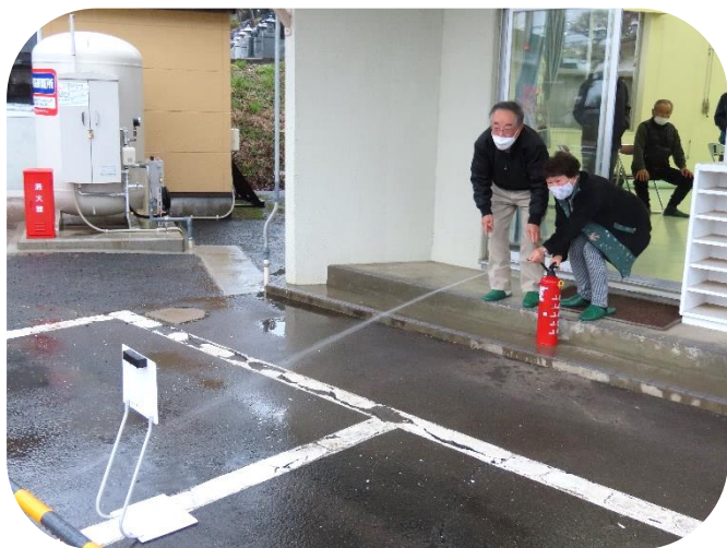
▲「火事だー！」 消火訓練の様子。

小斎塾閉講後、塾生のみなさんに小斎まちづくりセンターの消防訓練にご参加いただきました。