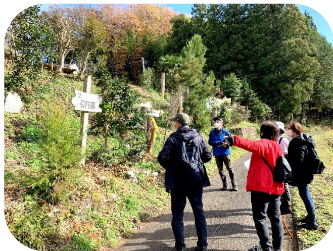
▲ 山口の「弥陀墓」にて。